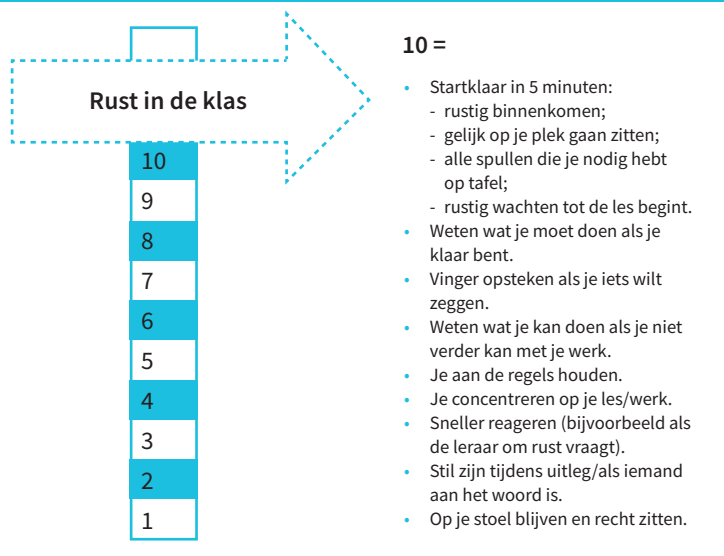
Figuur 3: Doel 1 van een brugklas vmbo-tl.

Laat de leerlingen meedenken middels een gesprek of met creatieve werkvormen. Je kunt hen bijvoorbeeld hun ideeën op gekleurde plakbriefjes laten schrijven en deze verzamelen op het bord. Cluster de briefjes met de klas tot de belangrijkste doelen. Kies vervolgens met de leerlingen waaraan zij eerst willen werken (doel 1, zie figuur 3).